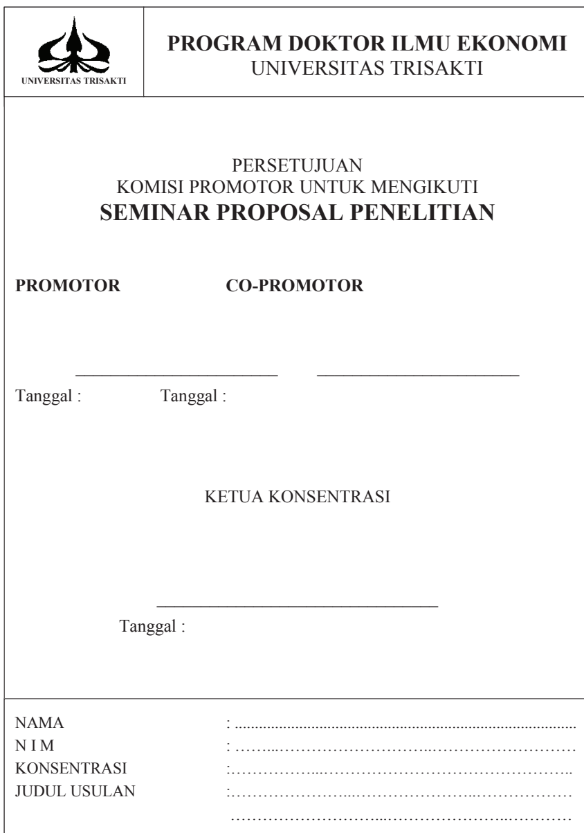
Lampiran-3: Contoh Form Persetujuan Komisi Promotor Untuk mengikuti Seminar Proposal Penelitian